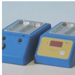
Thermoblock/ Inkubator für Snap-Test