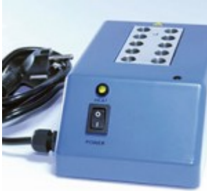
Thermoblock/ Inkubator für BRT-Test