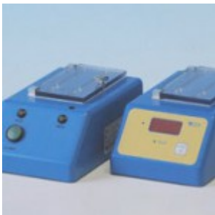
Thermoblock/ Inkubator für CHARM-MRL-Test