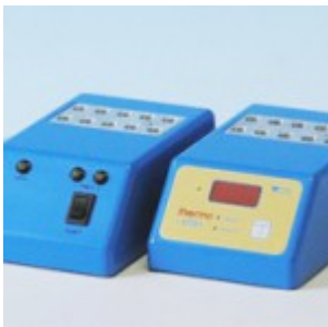
Thermoblock/Inkubator Penzym für CHR.Hansen-Test