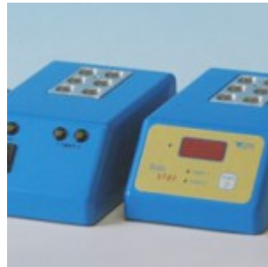
Thermoblock/Inkubator für CHR.Hansen-Test