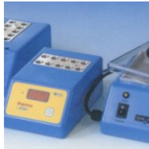
Thermoblock/ Inkubator CH-ATK für CHR.Hansen-Test