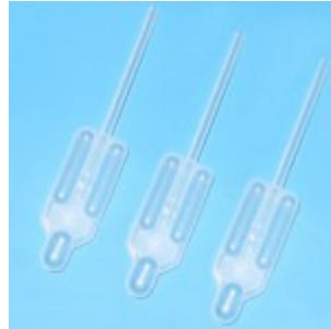
Pasteur Plast Pipetten